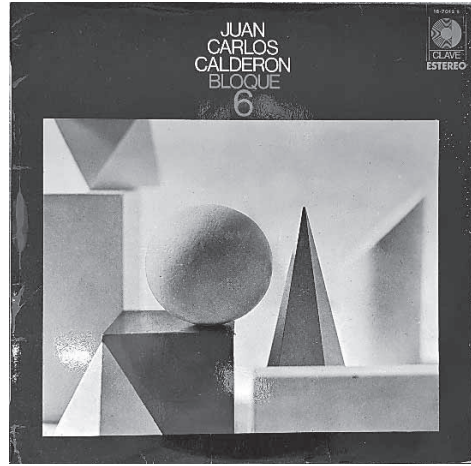
Ilustración 6: portada de la reedición de Bloque 6 en el sello Clave (1975).

Una de las aspiraciones declaradas de Calderón a mitad de la década de los sesenta era “escribir, arreglar y dirigir un concierto de jazz, todo para gran orquesta: bras [sic], madera y viento, con tres o cuatro solistas” (Mantilla, 1966). Entre 1967 y 1968 25 , Calderón reunió una big band ampliando su Jazztet: